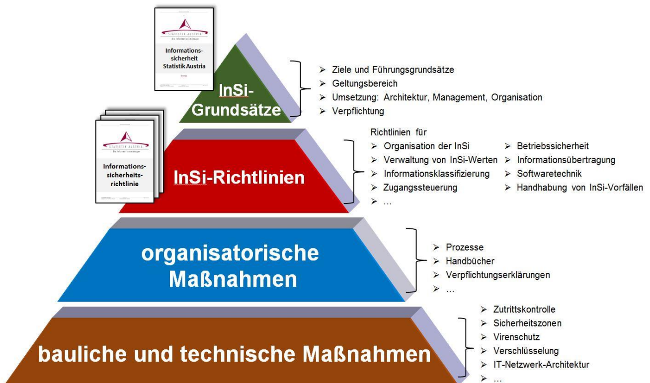
Abbildung 1: InSi-Architektur

Die InSi-Architektur legt die Hierarchie von Grundsätzen, Richtlinien und Maßnahmen fest – siehe Abbildung 1: