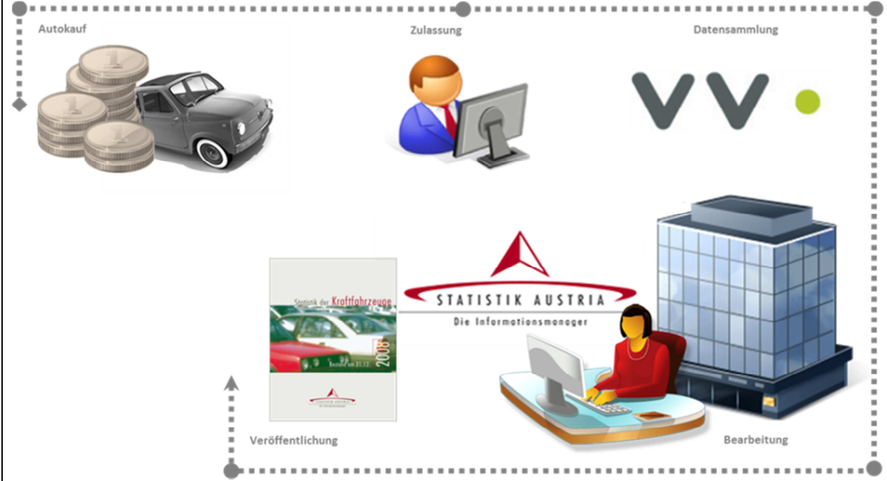
Abbildung 1: Ablauf - von der Anmeldung zur Kfz-Statistik